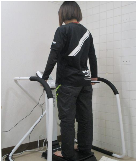
測定時の様子。3分程度で終了。 (ペースメーカー及び妊娠中の方はご遠慮ください。)

ご依頼会場に測定機器を持出しできますので、運動の成果確認や健康づくりにご活用ください。